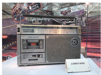
三洋牌双卡录音机