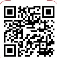
扫“掌上龙岗” 参加短视频大赛