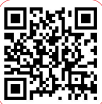
扫“龙岗发布” 送他们C位出道