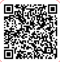
扫“龙岗青年先锋” 报名游泳解暑啦