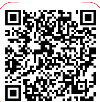
扫“深圳侨报” 避开错误举报方式