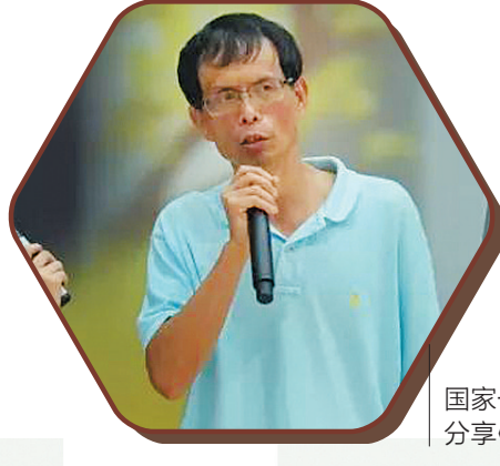
国家一级作家、原深圳大学文学院副院长南翔,分享《阅读的七扇窗口》。