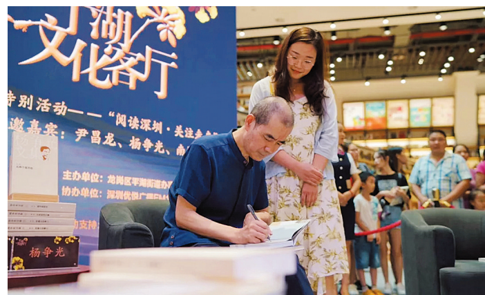
深圳市作家协会副主席杨争光现场签名赠书。