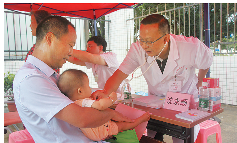
新区医疗健康集团组织专家开展义诊。

2020年是推动深圳市卫生健康事业高质量发展、加快打造健康中国“深圳样板”的重要阶段,也是推进“健康大鹏”建设的关键节点和新区基层卫生工作大有可为的战略机遇期。姜红强调,要从深化内涵着手,丰富家庭医生服务惠民体系;从能力提升着手,做强社区健康机构服务体系;从下沉协作着手,构建基层医疗卫生支撑体系。深刻理解和把握战略机遇期形势和需求内涵的变化,推动基层卫生创新发展、协调发展、优质发展、跨越发展,打造新区专属的“大鹏社康模式”。