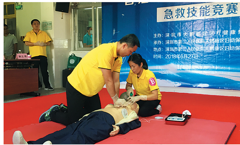
新区举行首届“大鹏社区健康杯”急救技能竞赛。