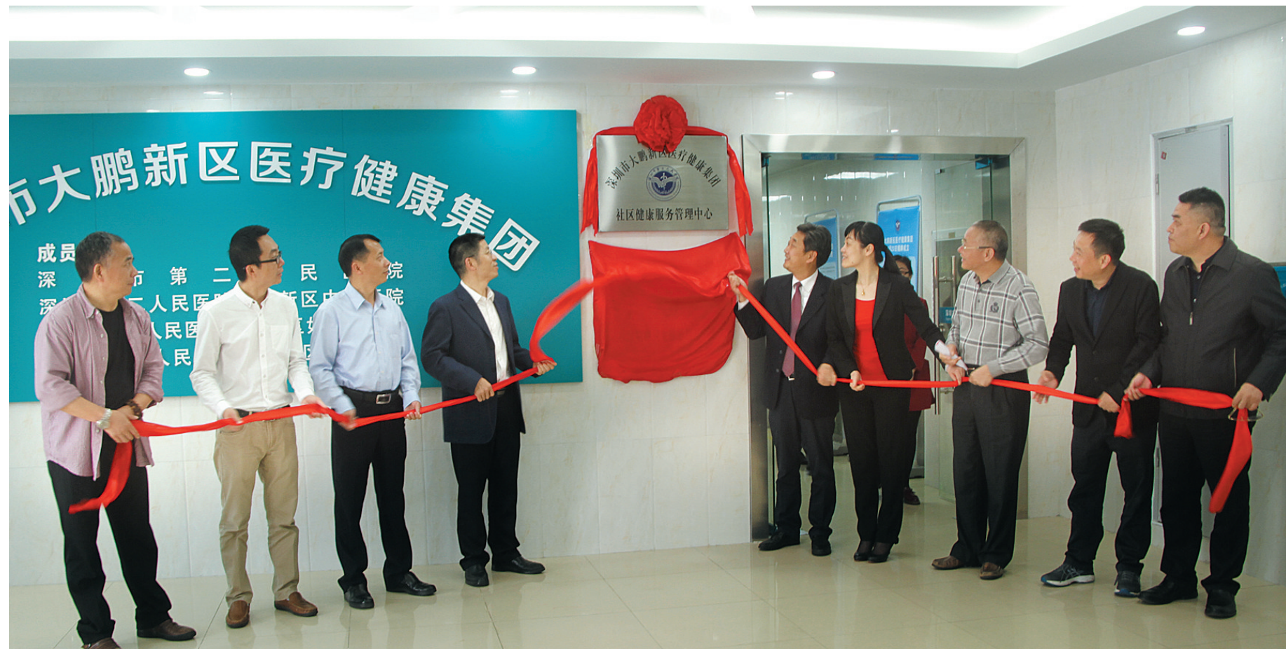
大鹏新区社区健康服务管理中心及社区精神卫生服务管理中心揭牌成立。

记者从昨日大鹏新区医疗健康集团召开的“大鹏新区社区健康服务工作会议暨业务培训”上获悉,自去年6月23日成立后,已建立起“社康中心-区级医院-市级医院”无缝衔接的三级诊疗服务体系,开创了市、区医疗资源纵向整合的“大鹏社康模式”。市医管中心副主任郑国彪,新区党工委委员、管委会副主任姜红等出席活动。