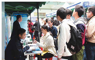
招聘现场人头攒动。

跨境电商类企业的吸引力源于其顺应市场发展潮流,同时具有较优厚的福利待遇以及较快的上升渠道。毕