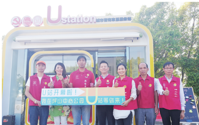
义工们与城市咨询志愿服务U站合影。

首批启用的城市U站分别位于坪山中心公园和六和城益田假日世界广场。记者看到,这两个新型城市U站外观活泼、现代,明黄色的条形灯组成坪山的缩写“PS”,并有绿色植物装饰。