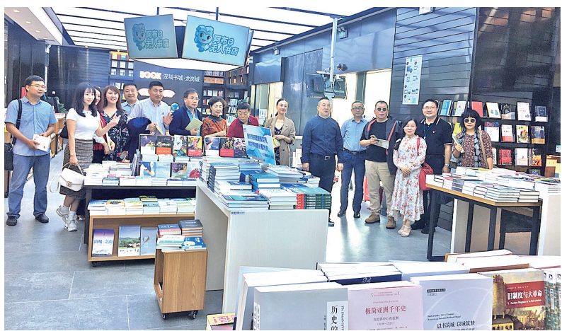
13位来自全国各地的著名作家参观龙岗“红立方”公共艺术馆、深圳书城龙岗城内的无人书店。

本报讯(深圳侨报记者 石小利 通讯员 文姝琴)昨日上午,由中国作家杂志社和龙岗区委宣传部共同举办的“讴歌新时代 诗书画龙岗”2018中国著名作家龙岗行活动在深圳市龙岗区“红立方”公共艺术馆拉开序幕。中国作家杂志社主编王山以及13位来自全国各地的著名作家受邀前来,到大芬、甘坑、南岭村等具有代表性的文化地标、自然景观参观,从中汲取灵感。中国作家杂志社主编王山,深圳文联主席李瑞琦,龙岗区委常委、宣传部长胡庚祥,龙岗区副区长尚博英等领导嘉宾出席开幕式。