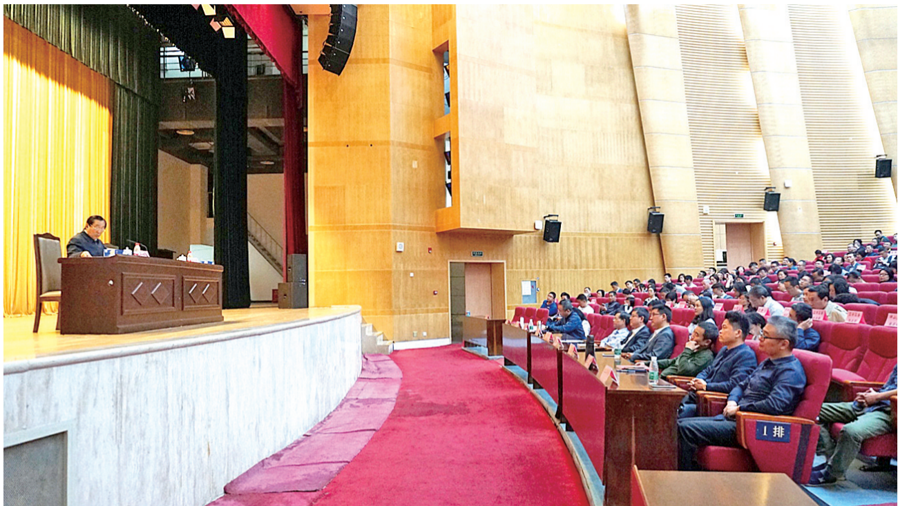
全国政协原副主席、民革中央原常务副主席齐续春作专题报告。

市委统战部及人事代管单位全体干部职工,各区(新区)统战部门主要负责人,市各民主党派代表和无党派人士,深圳市党外领导干部专题研讨班及第三十四期民主党派、无党派人士培训班