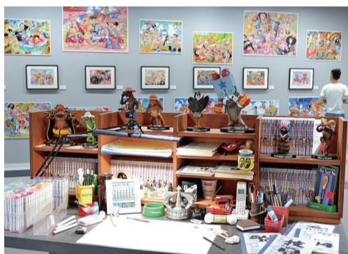
1:1复原的尾田工作台。