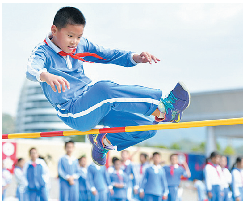
运动会现场。深圳侨报特约记者 李坚强 摄

运动会的成功举办,不仅锻炼了学生的体力,考验了学生的体能,展示了他们的个性和青春活力,还磨砺了学生克服困难的意志品质,培养了他们的合作精神,增