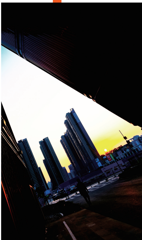
作品:《绚丽(深圳·红立方)》作者:何利剑

经过为期24天的征稿、整理、评审,主办方从2000多幅参赛作品中评选出一批获奖作品,并于12月8日至18日在2013文化创客园进行展览。凸显了龙岗良好的文化产业发展土壤,展示了龙岗文化产业发展的蓬勃前景。