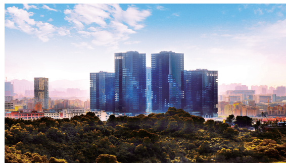
作品:《天安云谷》作者:郑焯