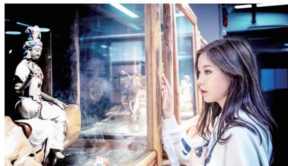
作品:《时·空(坂田创意园)》作者:张义