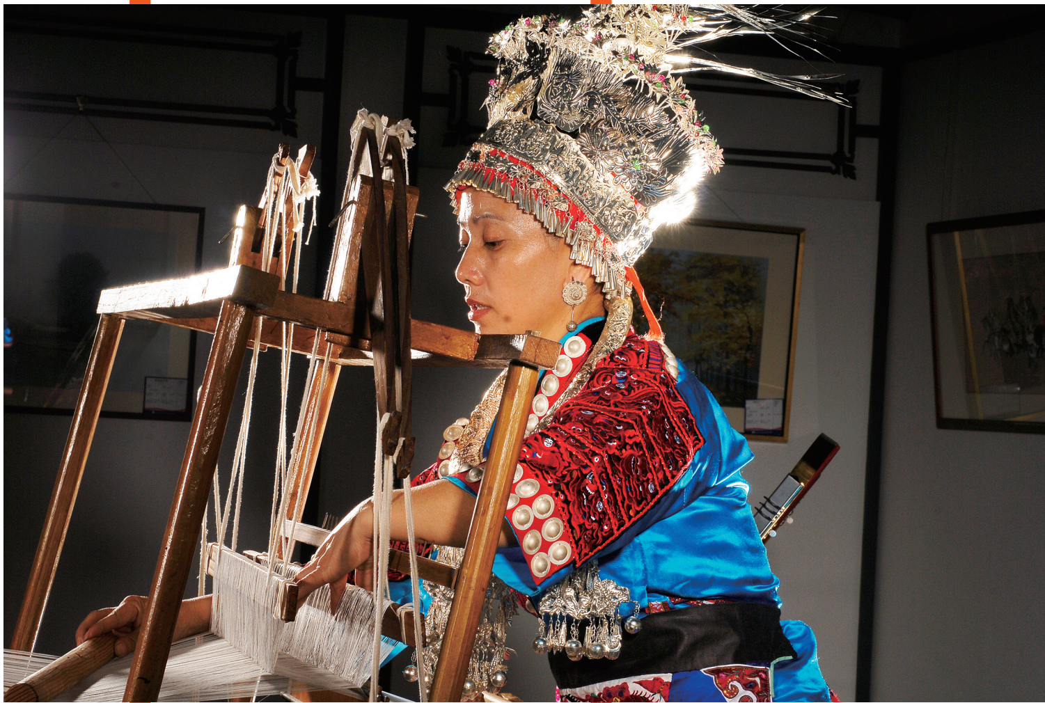
作品:《中国丝绸(布吉南湾中丝园)》作者:刘培聪