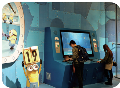
制作小黄人“放屁枪”