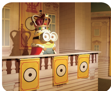
戴上皇冠的小黄人