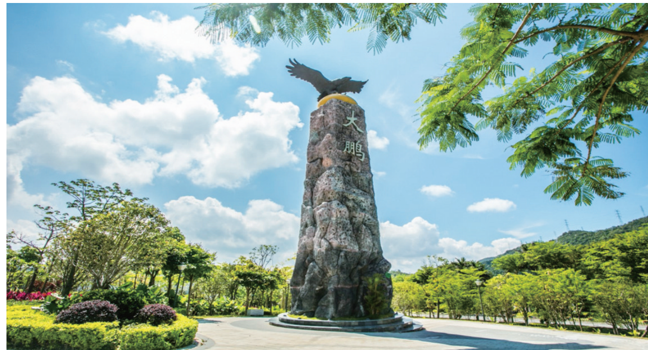
大鹏新区将打造成独具特色的“山海花城”。

人勤春来早,奋进正当时。春节期间,大鹏城管人尽忠职守,奋战一线,精心服务,全力做好市容环境美丽整治、灯光环境靓丽多彩、森林防火等工作,为市民欢乐祥和过春节创造一个清洁美丽的环境。新春伊始,频传喜讯,生活垃圾分类工作跻身全市优秀行列,1月葵涌办事处环卫进步指数全市排名第2,大鹏新区公共厕所环境指数全市排名第3……“当好城市管家,守护大鹏之美,以如椽巨笔绘就大鹏‘高颜值’画卷。”新年伊始,大鹏新区城管局局长高宏对全局新年工作作出部署,认真梳理全年工作的热点、难点,要求2019年新区城管工作不仅要保基本保重点,还要出亮点,补齐短板,打赢翻身仗,实现年初“开门红”、全年“满堂红”。