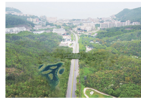
大鹏新区率先启动建设全市首个生态廊道。