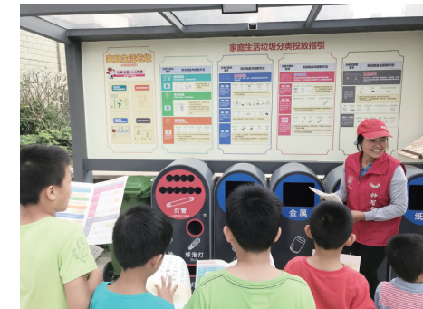
垃圾分类渐成大鹏新时尚。