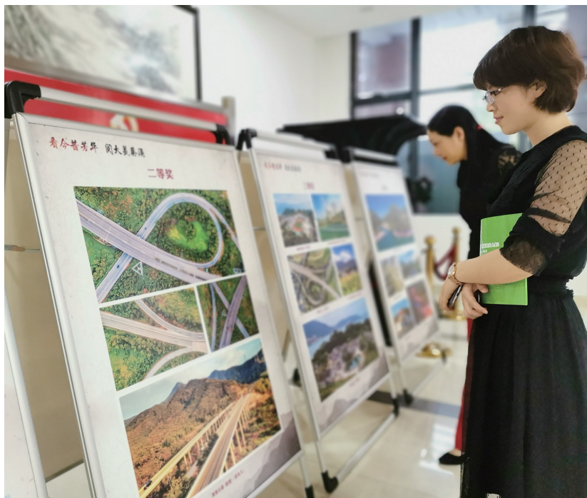
摄影作品展吸引干部职工纷纷驻足观赏。

本报讯(侨报融媒记者 陈智美 通讯员 张俊聪)昨日,葵涌办事处举办第二届“最美葵涌”摄影比赛颁奖活动。葵涌办事处相关负责人向获奖人员颁奖,并邀请获奖人员分享了摄影体会。