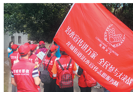
活动现场。

龙城街道相关负责人表示,接下来,街道还将继续依托各志愿服务站点阵地、治水志愿服务队伍开展治水宣传等志愿服务,还将在现有志愿服务基础上开展