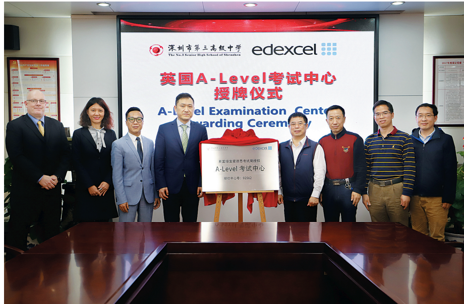
英国培生爱德思考试局(EDEXCEL)授权市三高A-Level教学和考试中心。