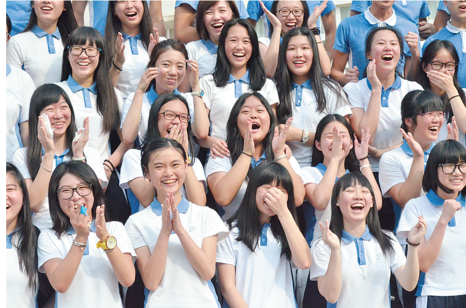
阳光快乐的市三高学子。