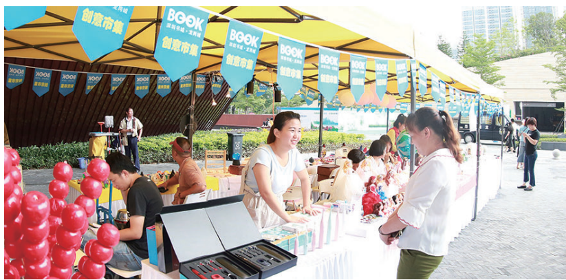
深圳书城龙岗城分会场开展的创意市集活动。

本报讯(侨报融媒记者 石小利 通讯员 胡艳丽) 昨日下午,第十五届中国(深圳)国际文化产业博览交易会深圳书城龙岗城分会场开幕。全国政协委员、中国音像与数字出版协会理事长孙寿山,深圳市委宣传部副部长、市文明办主任陈庆澜,龙岗区委常委、宣传部长胡庚祥等出席开幕式。