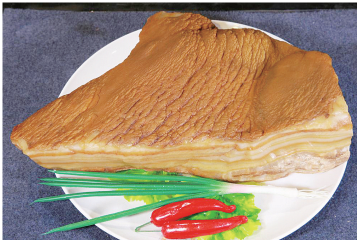
现场展出的阳江肉石让人“嘴馋”。

据介绍,阳江肉石虽然题材都是“肉”,种类却非常丰富,从皮、质、色的特点中可以分出十几种类型。“大到上万元,小到1000多元的肉石近期都有成交记录。”龙园相关负责人表示,随着龙园展会平台的宣传与带动,当地的肉石玩家的推广意识不断增强。此次龙园展也是阳江肉石石友首次走出去参展。自此,全国的石友尤其是肉石爱好者们又认识了一个优秀的肉石品种。