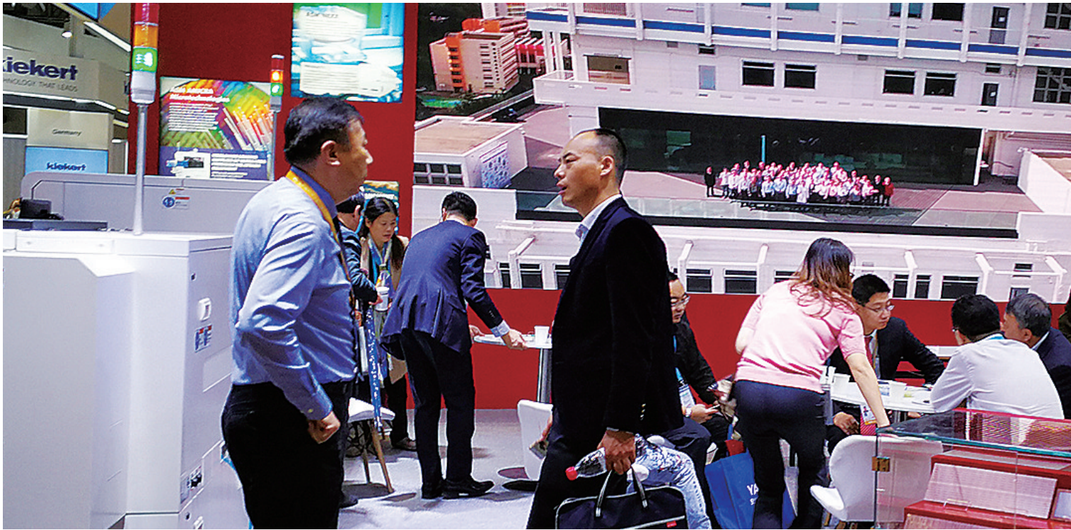
昨日的进博会现场,18家龙岗企业通过现场参观了解,与部分国外企业初步达成采购或合作意向。

本报讯(侨报融媒特派首席记者 张祥)昨天是进博会开幕第二天,已做好充分准备的龙岗交易分团就取得了不少收获。其中,龙岗企业深圳先进微电子科技有限公司(以下简称先进微电子)的所属集团分别与甘肃天水华天电子集团、深圳金铄公司签下大单,设备将会由先进微电子公司承接制造,签约采购额超过1亿美元。当日,龙岗交易分团企业团共有18家企业通过在博览会现场的参观了解,与部分国外企业初步达成了采购或合作意向,除先进微电子公司这笔大单外,龙岗企业当日还完成了约5.9亿元的采购额。