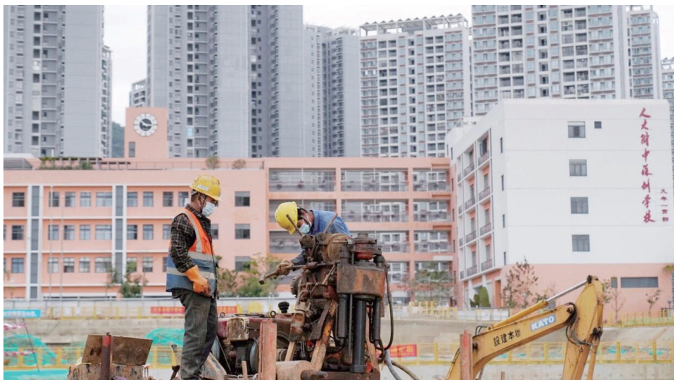
人大附中深圳学校(九年一贯部)二期工程有序复工。

新冠肺炎疫情期间,在新区建筑工务署指导下,项目组制定了一系列防疫“硬指标”,包括每天对施工现场和公共区域等喷洒消毒液、设置临时隔离点、返岗人员建立“一人一档”、分餐制等。作为大鹏新区重点民生项目,为了赶上工期,项目组人员根据实际情况制定科学合理的施工计划,现场工人有序进行作业。目前,现场增加了10个工人,泥土车由原来的35辆增加到40余辆,项目组后期将根据实际增加其他设备,多工作面开展作业,同时加大防疫物资、防雨物资保障力度,确保项目有序、高