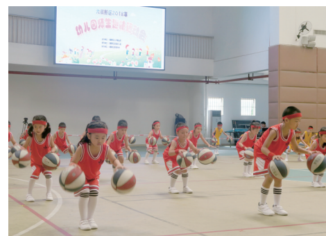
葵涌第二小学形成浓郁的足球文化氛围。深圳侨报通讯员 魏国勇 摄

本报讯(深圳侨报记者 蔡晓君 通讯员 陈纪达 邱旭) 近日,2019年广东省教育教学成果奖获奖名单正式公布,新区两个基础教育类项目荣获二等奖,分别是葵涌第二小学的“创建校园足球文化的行动研究”和葵涌中心小学的“小学科学对比实验概念图教学模式的运用研究”。