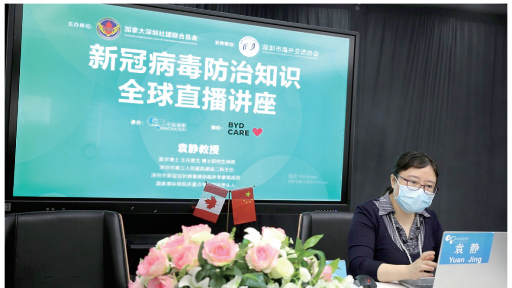
讲座直播现场。

美国、南非、阿联酋、马来西亚等国的侨胞纷纷就如何进一步做好疫情防护工作发问。他们盛赞此次讲座干货满满,教会了大家许多科学有效的防疫知识,在侨胞和疫情间筑起了一道坚固的防线。阿联酋深圳经贸文化促进会会长张钦伟表示,阿联酋的疫情日益严重,观看了直播讲座后,当地华侨华人对疫情有了正确的认识,防护工作将做得更好。