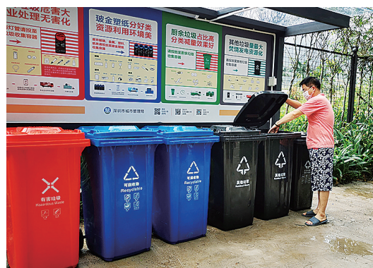
大鹏办事处在小区一期增设垃圾投放点。

接下来，大鹏办事处将继续加强垃圾分类摸排工作，听取居民的意见和建议，提供更好的服务，不断提高辖区居民对垃圾分类的支持和参与率，助力高质量“美丽大鹏”建设。