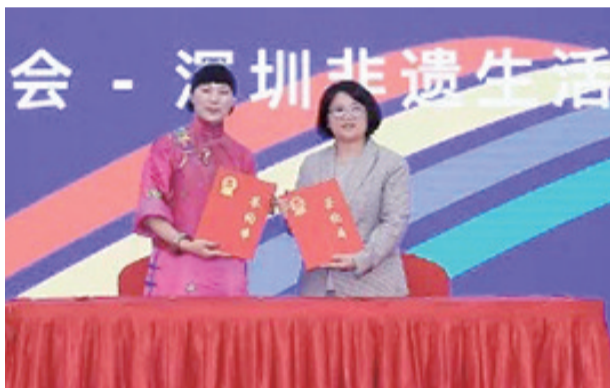
第四届深澳文旅创意设计大赛获奖者上台领奖。