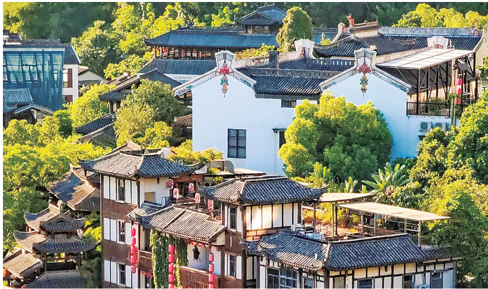
甘坑客家小镇亭台楼阁充满古韵。

事实上，自2016年进驻甘坑客家小镇以来，华侨城集团就围绕“文化+旅游+城镇化”战略模式，努力将其打造为集文化、生态、科技、旅游于一体的“中国文创第一镇”，走出一条卓有成效的“IP Town”发展之路。此后几年间，通过开发IP孵化策略，甘坑客家小镇逐步形