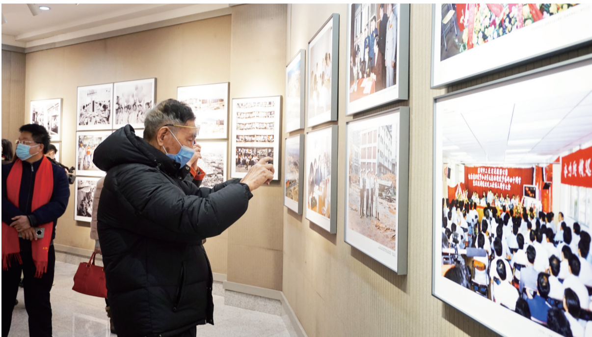
市民拍下历史照片留念。

据了解，《八卦岭之春》摄影展的主题策划以“纪录历史、感恩思源、传承精神、再创示范”为主旨，生动再现了上世纪80年代以来深圳经济特区大规模开发建设工业区的动人场景，歌颂深圳历代拓荒牛们敢闯敢试、敢为人先、埋头苦干的特区精神，摄影展突出特区改革开放和发展主题，把握大时代的历史脉搏，具有很强的时代感和艺术感染力。在布展策划和画册设计上力求创新、别具匠心，打破了历史纪实摄影展以时间顺序流水展现事件的传统思维，利用时间与事件纵横交错的组合对比和跨时空关照的魅力，艺术地展现了一个大时代波澜壮阔的历史画卷。