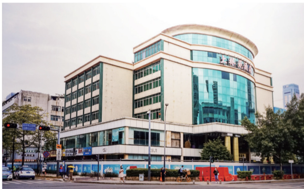
上世纪80年代中期的上林苑酒店。