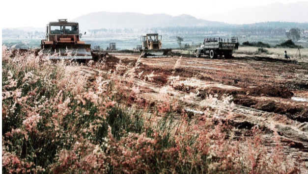
1982年9月14日，八卦岭工业区破土动工。