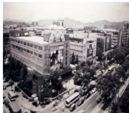
改造前的华强北和改造后的华强北。