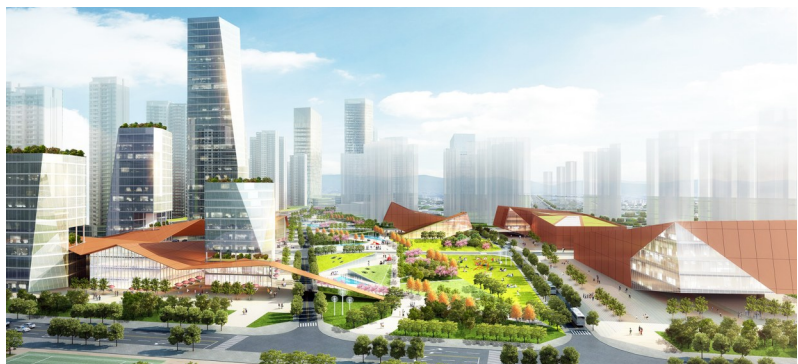
三溪片区重点城市更新效果图。

本报讯(深圳侨报记者 张译文 通讯员 晏梦辉)近日,大鹏新区三溪片区重点城市更新单元计划审查申请经新区城市更新和土地整备工作领导小组会议审议通过。这是新区城市更新计划立项的又一重大突破,后续将作为新区重点城市更新单元项目,由市规划和自然资源局核定申报情况后,上报市政府审批,最终完成计划立项审批流程。