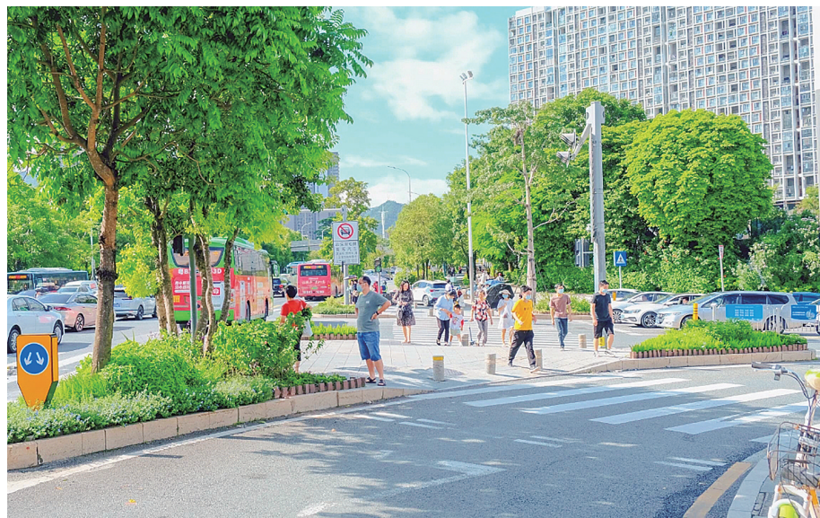
永香路与坂雪岗大道路口节点。

本报讯(龙岗融媒记者 杜和平 通讯员 万先海)夏尽秋来,金风渐至,在上班途中或是逛街路上,你留意过身边那一个个绿草如茵、鲜花盛放的小花园点缀在路口吗?近来,龙岗区城市管理和综合执法局在龙城、坂田、平湖以及横岗四个街道精选了20个节点,结合区域所属布局行业及产业特征,打造繁花似锦、独具特色的花园路口,提升居民生活品质和幸福感,勾勒美好民生幸福画卷。