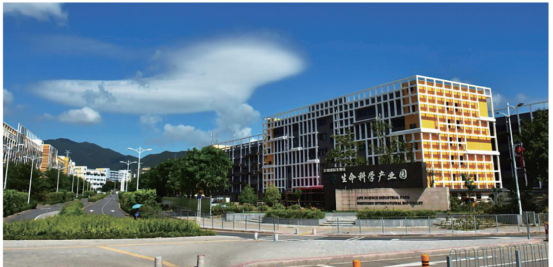
生命科学产业园。

生命科学产业园是深圳国际生物谷的重要组成部分之一，园区在有效推动国家基因库数据资源、基因资源应用、生命科学等各方面起到良好示范作用。近年来，新区投控公司聚焦生物、生命科学等新兴产业，加速汇聚科技创新要素，升级打造深圳国际生物谷生命科学产业园，不断完善创业创新基础设施环境，增强创业创新服务能力，勇当推动新区生物医药产业发展的排头兵，奋力打造生物生命产业新高地，为新区高质量发展培育新动能。目前，深圳国际生物谷生命科学产业园A、B、C三个园区累计吸引了80余家企业和科研机构入驻，其中生物医药类企业占比80%以上，包括荻硕贝肯、因诺转化医学研究院、国大生命科学院、华大海洋、鸿美诊断（诺贝尔奖团队）等行业领军企业，初步实现了生命医疗产业