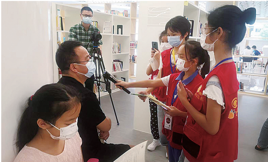
小记者们在龙岗区少儿图书馆内进行采访。

在少儿图书馆内，小记者们每四人一个小组，现场模拟新闻采访与拍摄。他们分工明确，有的负责提问、有的负责记录、有的负责拍照片，另外一个人负责拍视频。因为需要自己寻找采访对象，小记者们也在挫折中不断成长。