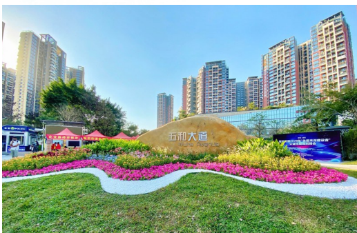
道路品质提升后的五和大道。