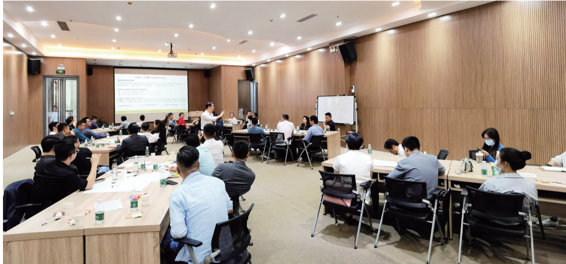
市工商联举办青年企业家企业经营管理沙盘实战模拟活动。