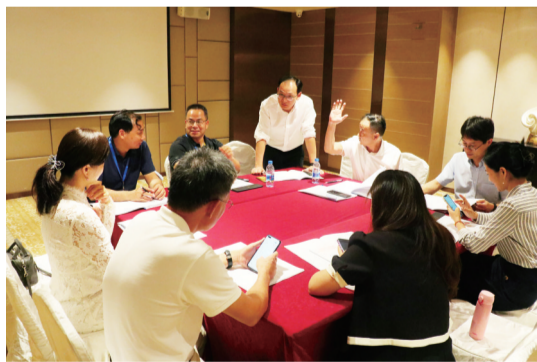
企业家们在活动中热烈讨论。