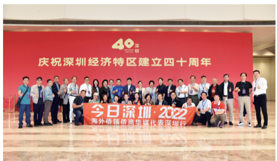
参观“从先行先试到先行示范——庆祝深圳经济特区建立40周年展览”。

11月14日至17日,由深圳市侨办、市侨联主办,市海外交流协会承办的“今日深圳·2022 海外侨领侨商华媒代表深圳行”活动在深举行,进一步激发了海外侨领、侨商、华文媒体向世界讲好深圳故事,参与深圳改革发展的热情。