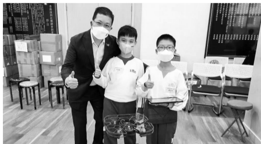
举办无人机编程挑战赛。

近日,香港深圳社团总会青年委员会迎来第六届新班子成员上任,青年工作不断向纵深推进。为更好地为青年搭建舞台,香港深圳社团总会积极举办无人机编程挑战赛、合办就业招聘博览会,坚持引领香港青少年深刻认识国家和世界发展大势,推动青少年绽放拼搏精神与青春活力,为青少年的发展创造更多平台与机会。