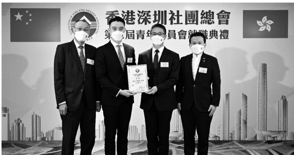
香港深圳社团总会青年委员会举行第六届新任班子就职典礼。