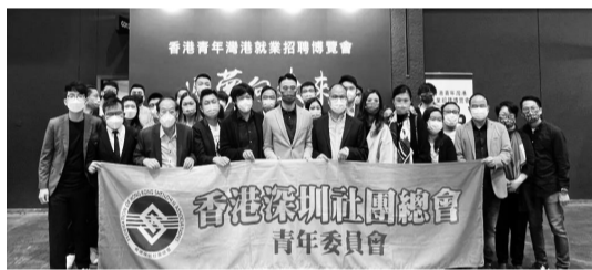
参与举办香港青年湾港就业招聘博览会。