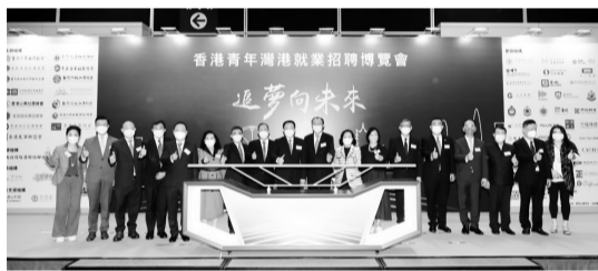
参与举办香港青年湾港就业招聘博览会。