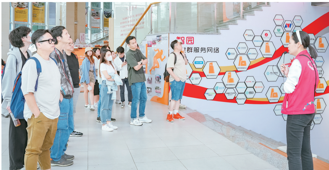
港澳青年组团走进南山智园。