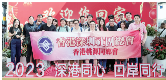
港澳青年组团到访南山区。

近日,深圳市南山区委统战部组织香港桃源、西丽等街道同乡会50余名港澳青年参访深圳前海、南头古城、何香凝美术馆、南山博物馆、南山智园等地,开展“国情深睇验”港澳青年深圳研学5S精品路线打卡活动,让港澳青年亲身体验南山区的发展变化,帮助他们更好地融入粤港澳大湾区建设。