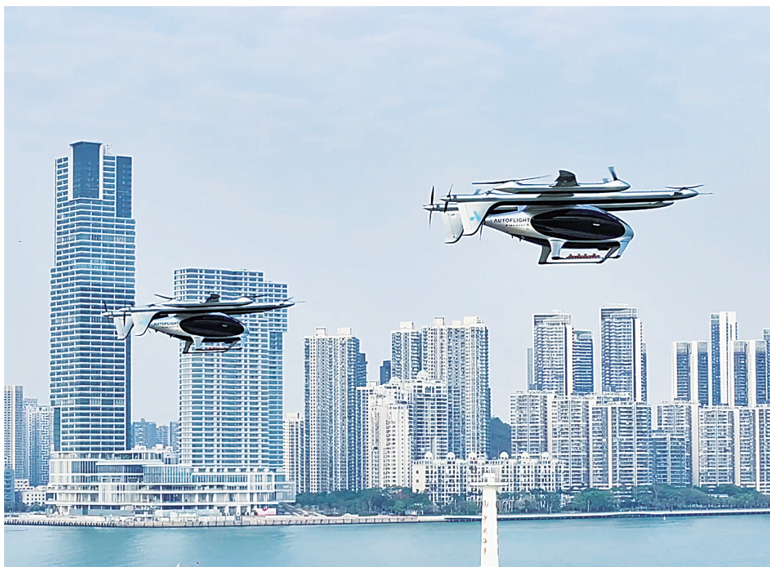
峰飞航空的电动垂直起降航空器完成国内首次跨城跨湾航线演示飞行。龙岗融媒资料图