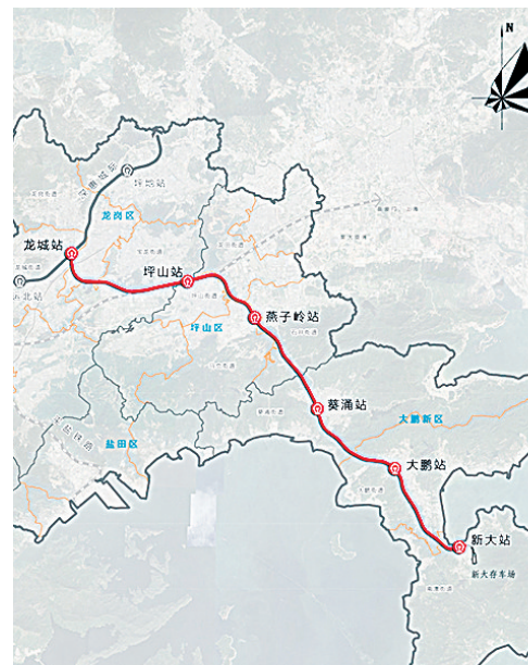
深惠城际大鹏支线路线方案图。

作为粤港澳大湾区城际铁路网络的重要组成部分，大鹏支线也是深圳“东进战略”的有力支撑，建成通车后可实现大鹏新区与龙岗区、坪山区半小时通勤。同时，通过换乘可快速抵达宝安机场、南山、前海等地将极大缓解大鹏的综合交通压力。