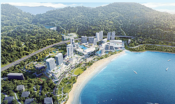
小梅沙片区整体鸟瞰效果图。