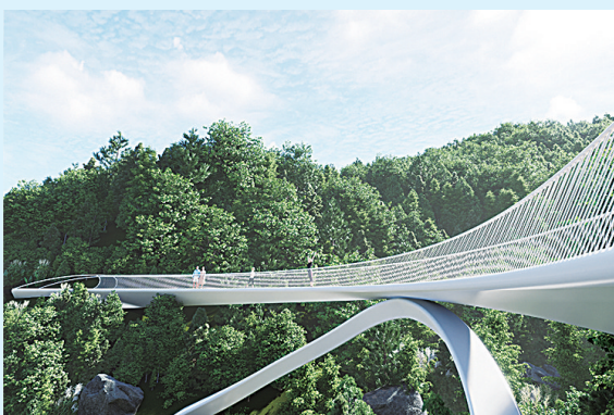
小梅沙叠翠湖郊野公园效果图。