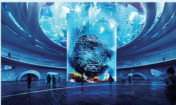
小梅沙海洋世界效果图。