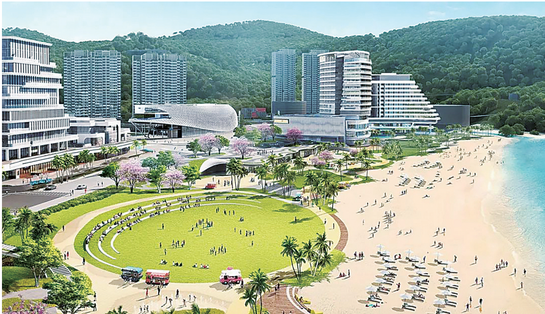
小梅沙海滨公园效果图。