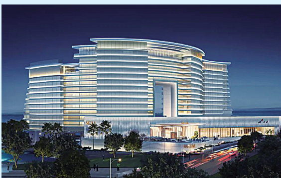
深圳美高梅酒店效果图。