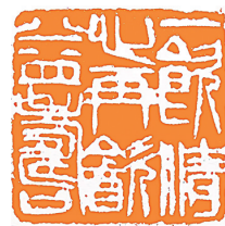
篆刻 一饮清心再饮益寿