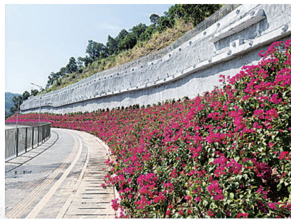
一朵朵簕杜鹃“绣入”边坡之上。