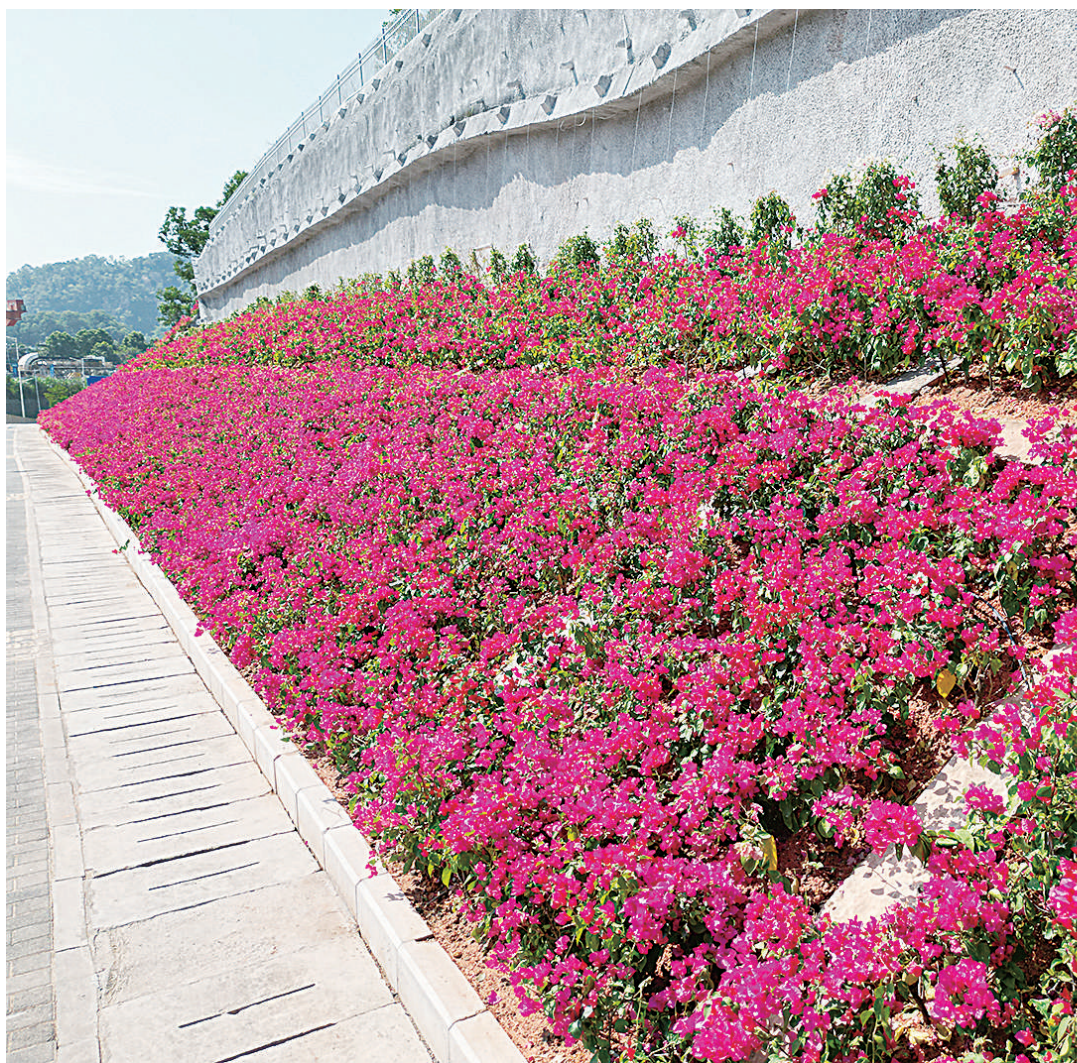
一条令人赏心悦目的花带。

本次专项提升工程不仅是吉华绿美生态建设的重要一环,为吉华构建片区绿美新格局奠定了坚实基础,还是吉华以绿美生态建设为牵引线打造示范标杆社区的重要工作之一,有效推动吉华实现“示范路-示范片-示范社区”华丽转变,切实扮靓城市街区绿化景观,绘好吉华街区“绿美一张图”。