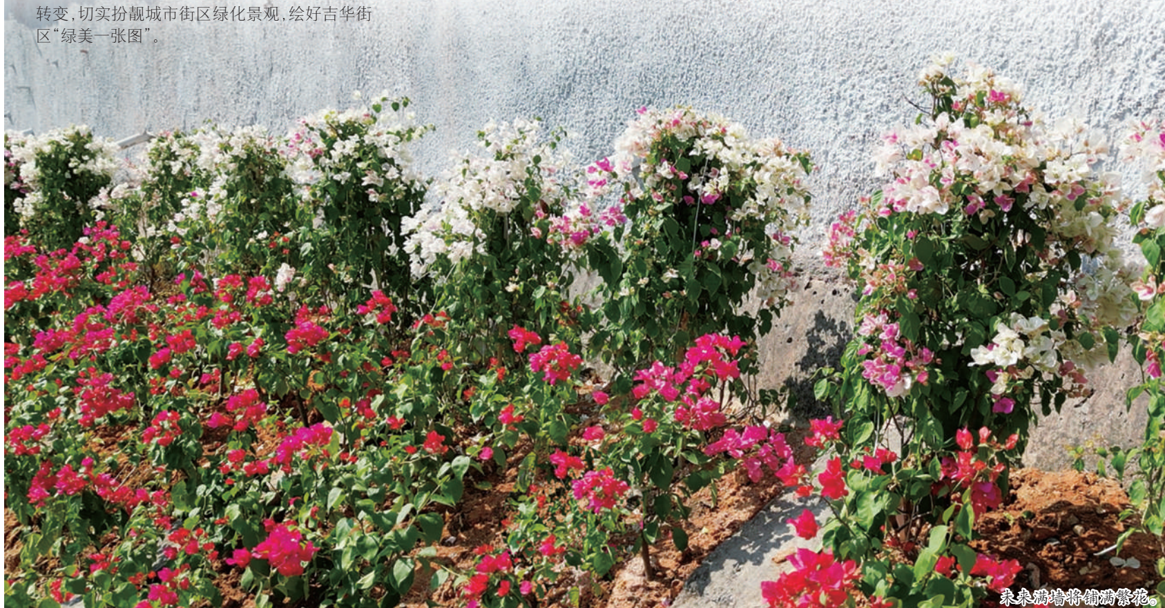
未来满墙将铺满繁花。