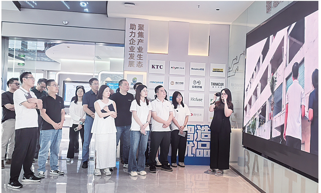
参观坂田街道企业交流服务中心共享展厅。

围桌而坐，直面企业发展中面临的市场拓展、融资需求、技术升级等痛点难点。与会企业畅所欲言，提出具体诉求；区、街道相关部门负责人现场办公、精准回应，并表示将建立清单、跟踪落实，切实将“四到”企业服务理念转化为解决企业实际困难的行动力。