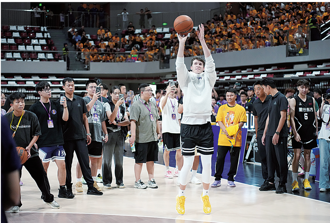
奥斯汀·里夫斯投篮瞬间。