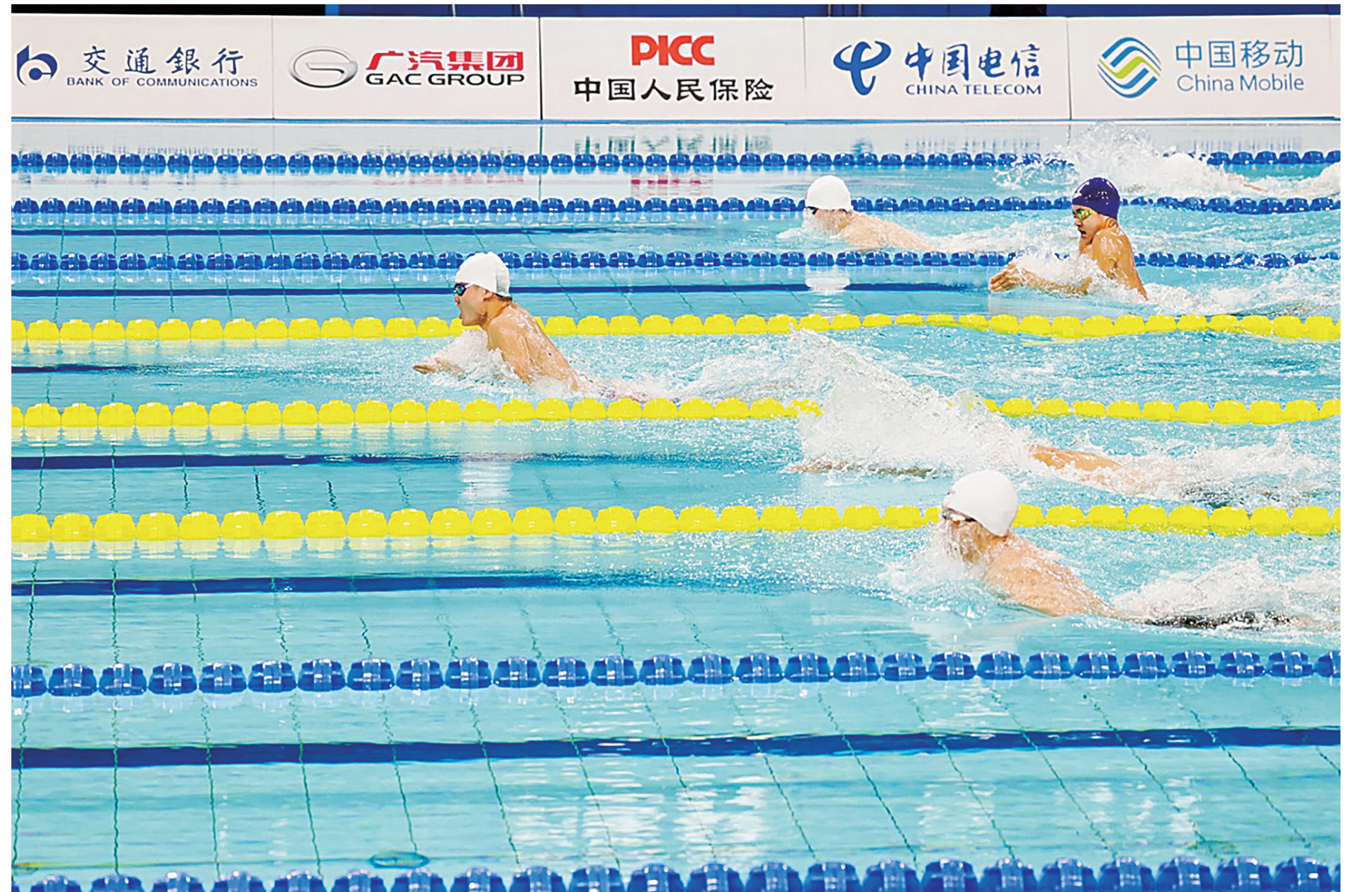
比赛现场。