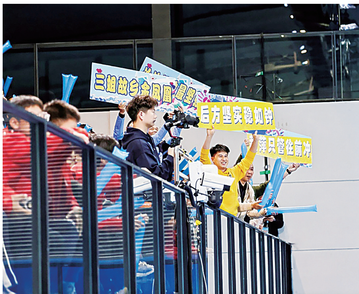
比赛现场。