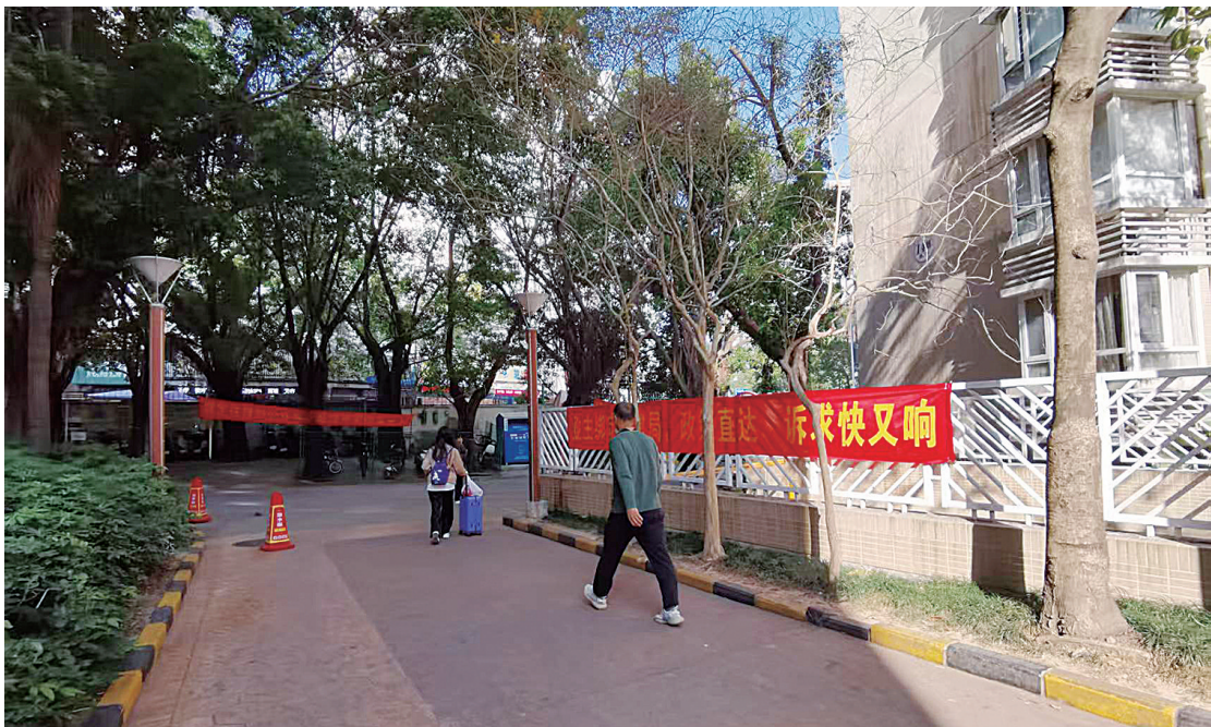
布吉街道理想家园小区内景。

2025年12月19日，在金排社区工作站现场开箱唱票后，业主大会表决通过罢免业委会负责人的决议。布吉街道平安法治办(物管)在情况说明中表示，将积极指导业主委员会组织召集业主大会，对业委会负责人进行任期和离任经济责任审计，并协助完成候补委员递补及重新备案等工作。