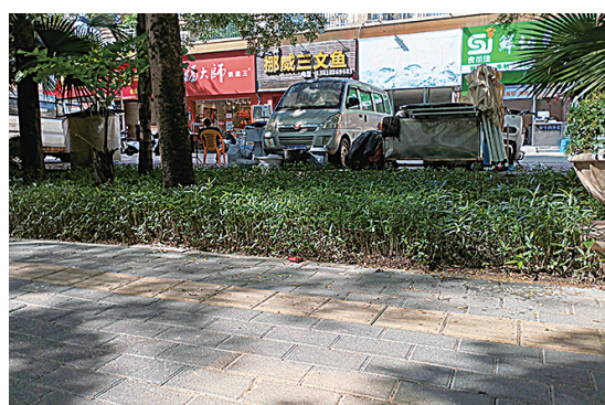
破损路面已修复。

据了解，经过相关部门的协调沟通，由深圳市交通运输局龙岗管理局相关科室对坪西路佳兆业水岸新都路段坑洼问题进行修复，坪西路新城路口至水岸新都二期门口人行道维修工程从2025年12月11日开工，对破损道砖进行替换并填补破损区域，已于2025年12月24日完工。