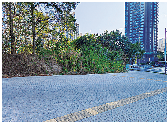
“僵尸车”被拖移后干净整洁的人行道。龙岗融媒记者 廖国鑫 摄

1月15日上午，记者回访时发现，相关部门已经依法将三辆车全部拖离现场，原本被车辆占据的人行道已恢复原貌，路面干净整洁，行人可安全通行。