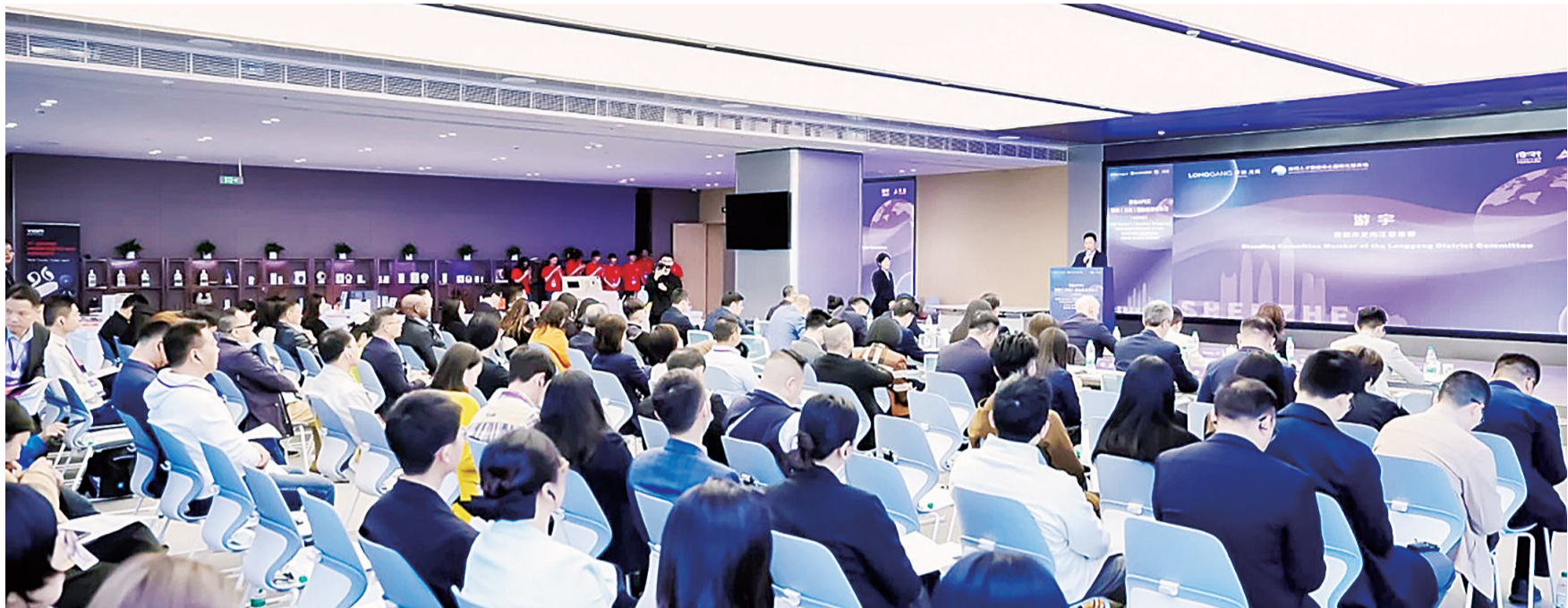
深圳(龙岗)国际经贸合作行(北美专场)“活动”。