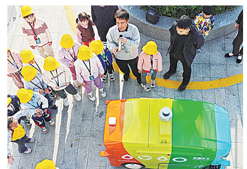
研学活动现场。

活动现场,工作人员通过讲解、实物展示及实操演示,向青少年们介绍了酷哇智能环卫机器人的核心技术与应用成果。大家近距离观察“独角兽”“麒麟”等系列环卫机器人,详细了解其自动驾驶、精准清扫、人机协同等核心功能,以及机器人如何高效完成多场景清扫任务、大幅提升保洁效率。演示环节中,机器人灵活避障、精准作业的场景引得大家阵阵惊叹,青少年们积极提问,工作人员逐一耐心解答,并结合街道智能环卫实践,生动讲解了保洁模式从人力密集型向数据驱动型的转变过程。此次活动让青少年们真切触摸到科技的力量,有效拓宽了科技视野,激发了科学兴趣。