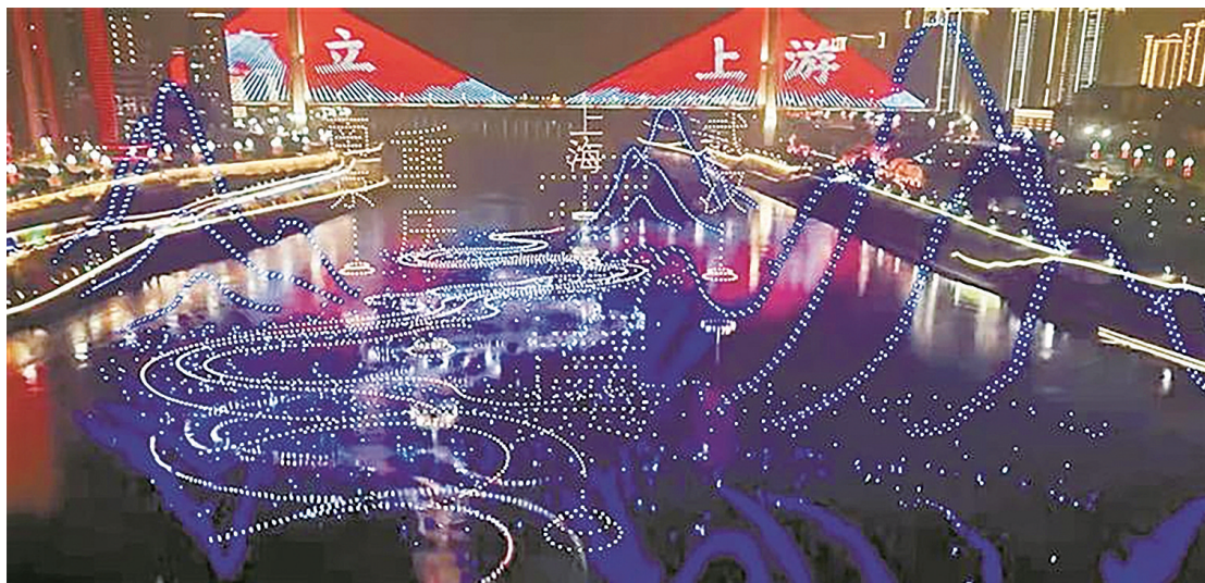
大漠大无人机表演亮相2026年春晚宜宾分会场。

本报讯(深圳侨报记者 尹萌 通讯员 高慧)2026年央视春晚,龙华民营企业利亚德为北京主会场和义乌分会场提供超2000平方米视效显示产品、舞美视觉创制及服务保障,这是利亚德连续27次亮相央视春晚。龙华民营企业大漠大则第7次亮相央视春晚以5000架无人机为宜宾分会场助阵。