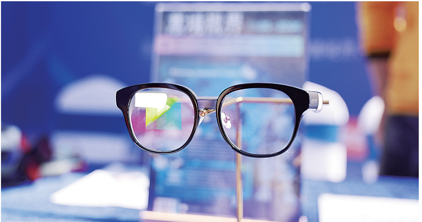
产自深圳的AI眼镜成为“广货出海”潮中最具爆发力的代表。