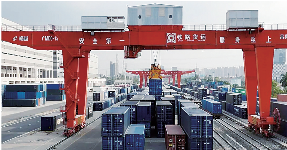
深圳国际综合物流枢纽中心货场。