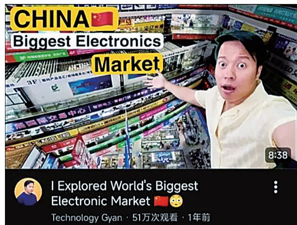
在华强北买个耳机就能斩获300万播放。