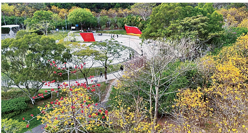
风光旖旎的平湖生态园。