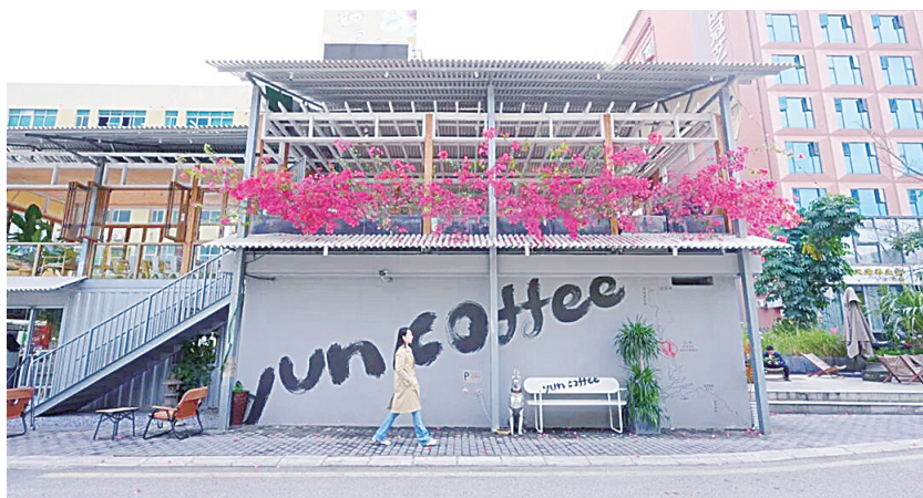
极具格调的DCC文化创意园。