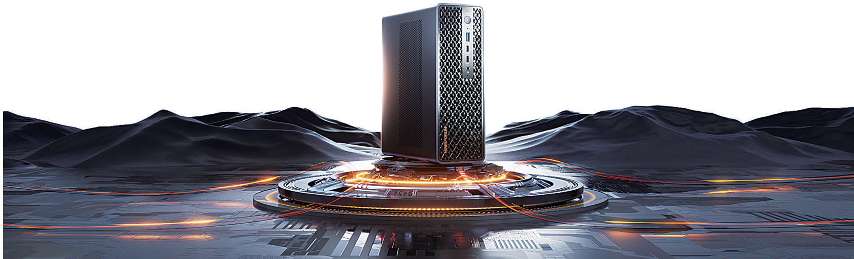
美高创新推出的迷你AI工作站产品。

在“龙岗一线发布”的镜头前，铭凡展示的不仅是一家企业的成长史，更是一种在快速迭代的科技行业中生存与壮大的方法论：以前瞻眼光锚定趋势，以扎实研发构筑硬件基底，最终通过软件与AI注入灵魂，在激烈的竞争中开辟出独特的价值通道。在AI深刻重塑所有行业的当下，这种“存算一体、软硬融合”的探索，为AI算力产业的未来提供了一个充满想象力的方向。