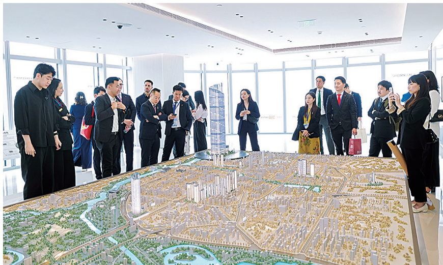
国际青年参观深润大厦。