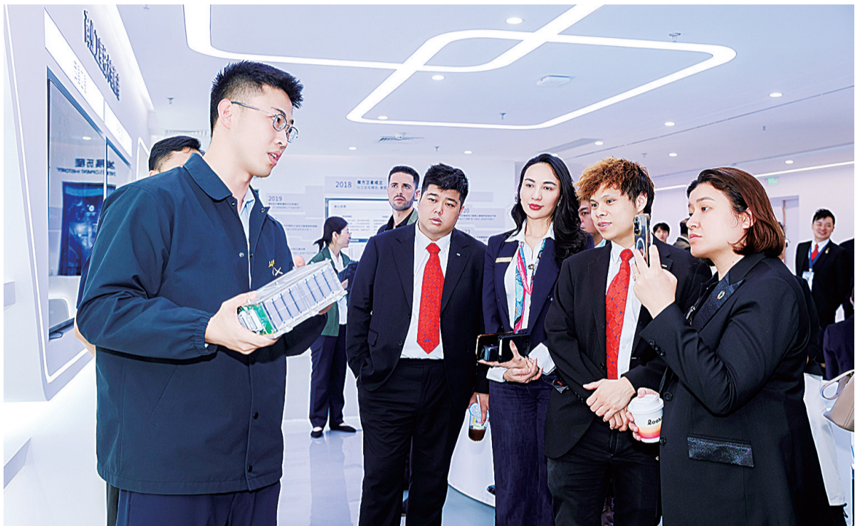
国际青年参观魔方卫星科技有限公司。

“不少国际青年来到罗湖亲身探访后，主动问我们‘我想来这里发展，该怎么做’，我想这就是交流的意义。”近日，来自俄罗斯、澳大利亚、日本、新加坡、哈萨克斯坦、越南等12个国家的近30名国际青年，与近20名香港青年一同走进罗湖，开启“国际青年罗湖行”的深度探索之旅。从实地参访到座谈研讨，大家一路沉浸其中，亲身感受罗湖在新兴产业培育、传统产业升级、深港融合发展、人才引进及营商环境优化等方面的鲜活实践。