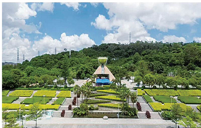
深圳市凤凰山国家矿山公园。