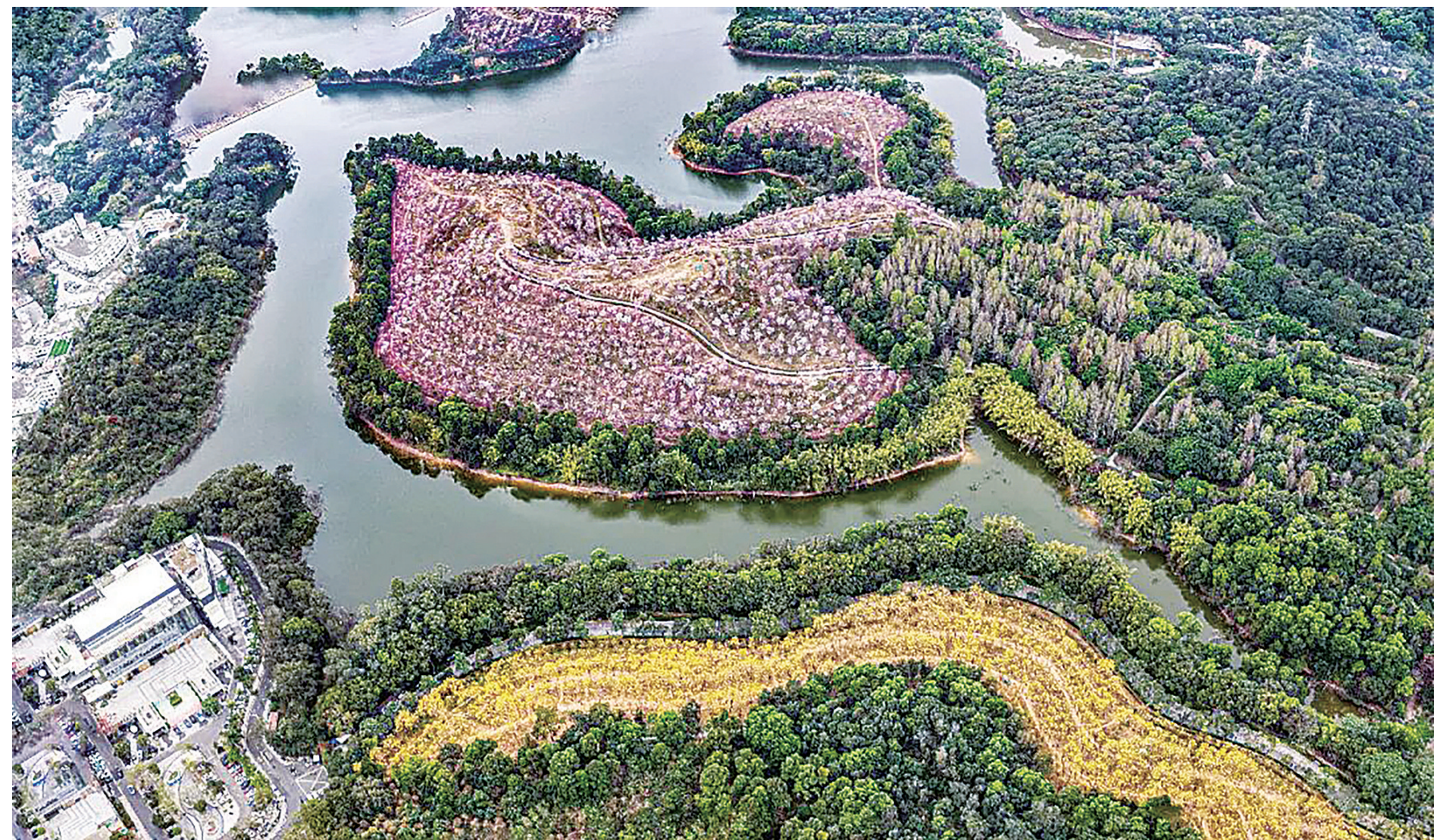
鸟瞰春日的平湖生态园。