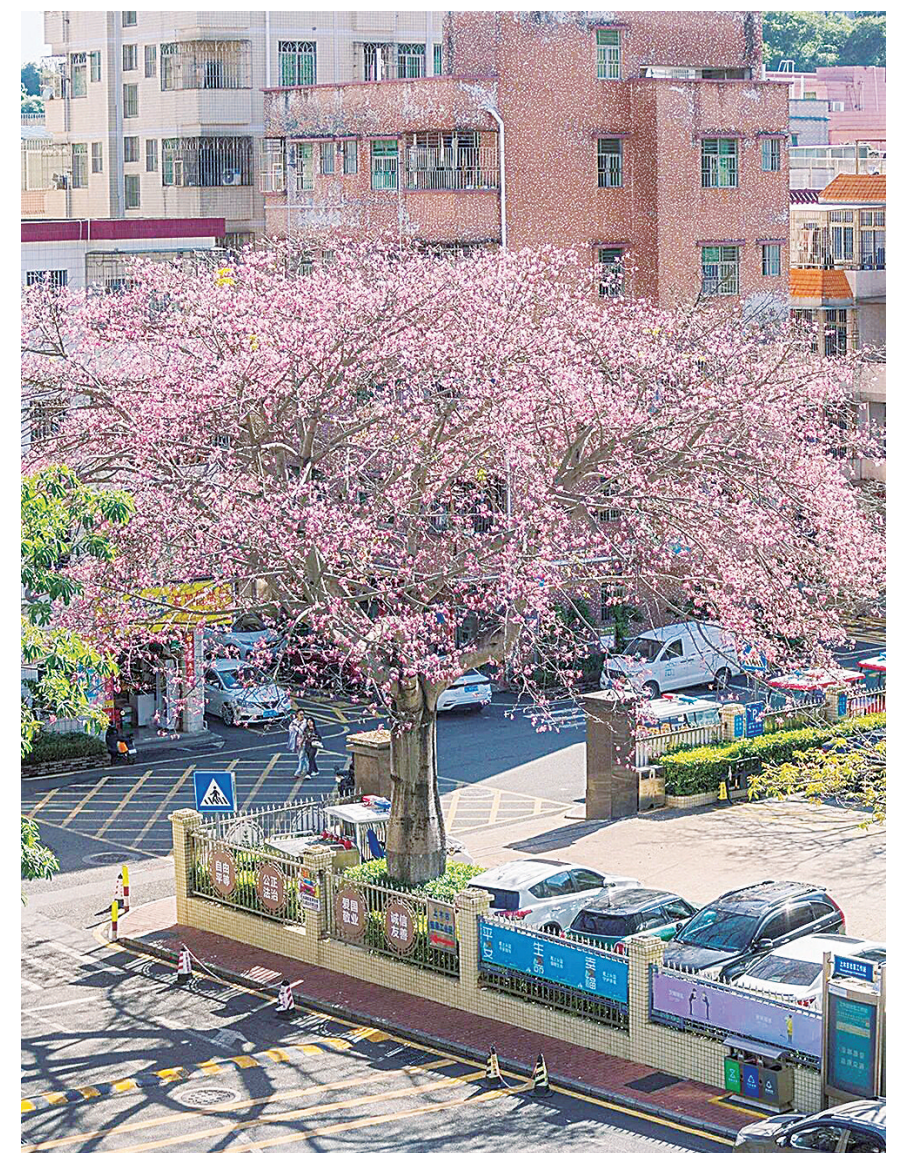
上木古社区的异木棉。