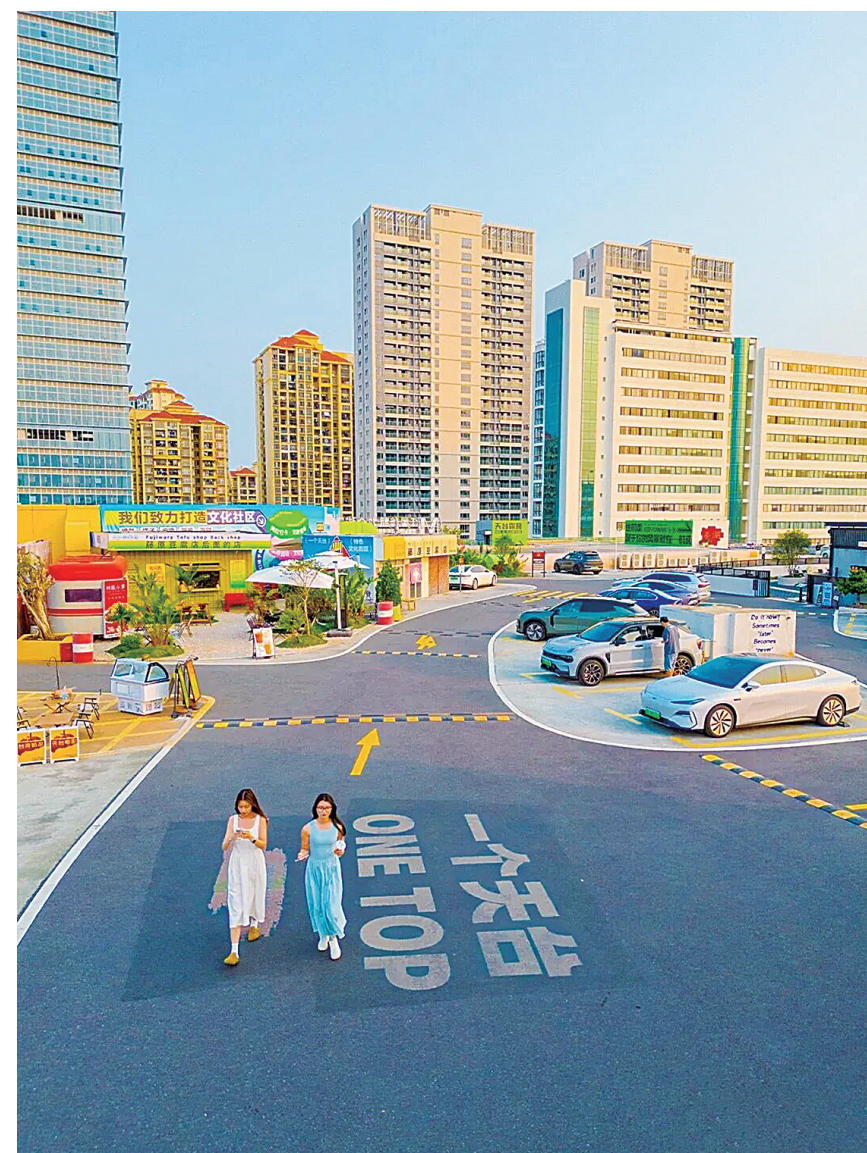
一个天台 ONE TOP。